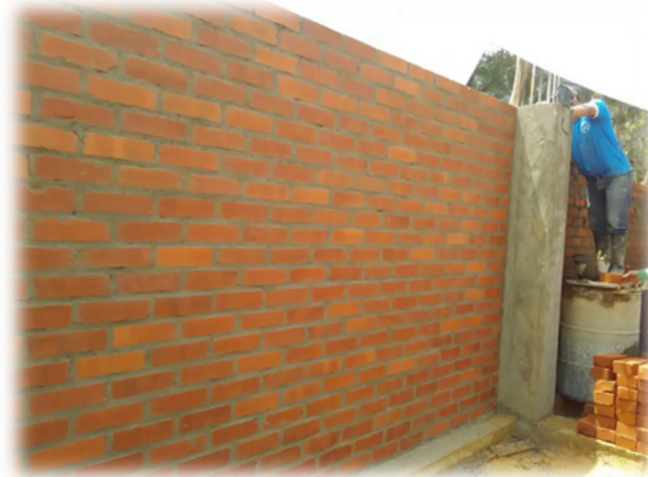
Centro de acopio de Afitej, ubicado en la vereda la Marqueza, con un 40% de construcción.

Junta Directiva de Afitej con conocimiento de funciones y responsabilidades frente a la Asociación y el Fondo Rotatorio.